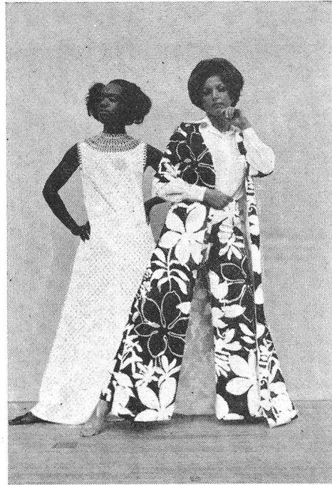
Homedress Baumwollbatist von Fisba, St. Gallen Modell: Habella SA, Frauenfeld

Der Internationale Wäsche- und Miedersalon mit Badebekleidung, der vom 18. bis 21. September 1969 in Köln durchgeführt wurde, gilt als grösste Veranstaltung dieser Art auf unserem Erdenball. Mit diesem Superlativ sei auf die Tatsache hingewiesen, dass dieser Salon von einer weltweiten