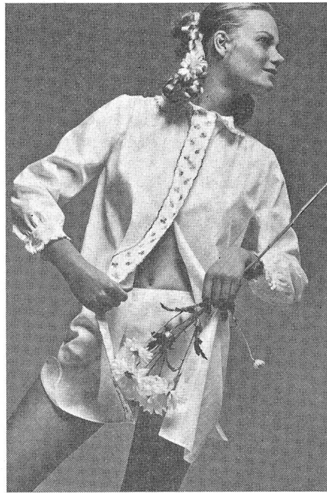
Schlafanzug aus weissem Batist mit Petit-Point-Stickerei Modell: Schiesser-S-Line, Radolfzell

Dinge ankommt. — Auch bei der Bademode ist der Setgedanke oberstes Gesetz. Hans Wolfmaier (Hengella) wies besonders auf den Partnerlook hin, dem er eine grosse Chance gibt. (?) — Abschliessend erläuterte Giselher Menge (Pompador) das Wort «Loungewear». Es handelt sich um einen neuen amerikanischen Kleidungsstil, nämlich um leichte Kleidung, auch Hosenanzüge, die sich so leger und so frei wie Wäsche trägt, die aber den Vorteil hat, damit «angezogen» zu sein.