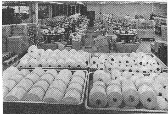
Automatenspulerei (Schweiter-Rundautomaten CA-11)

Besonders eindrücklich und instruktiv sind aber eine grössere Anzahl von Graphiken, welche die Entwicklung des Unternehmens aufzeichnen. Das Stammhaus in Wängi, wel-