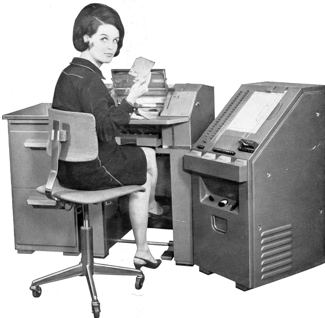
Modell Electronic 20 Modelle für jede Betriebsgrösse und jeden Arbeitsanfall