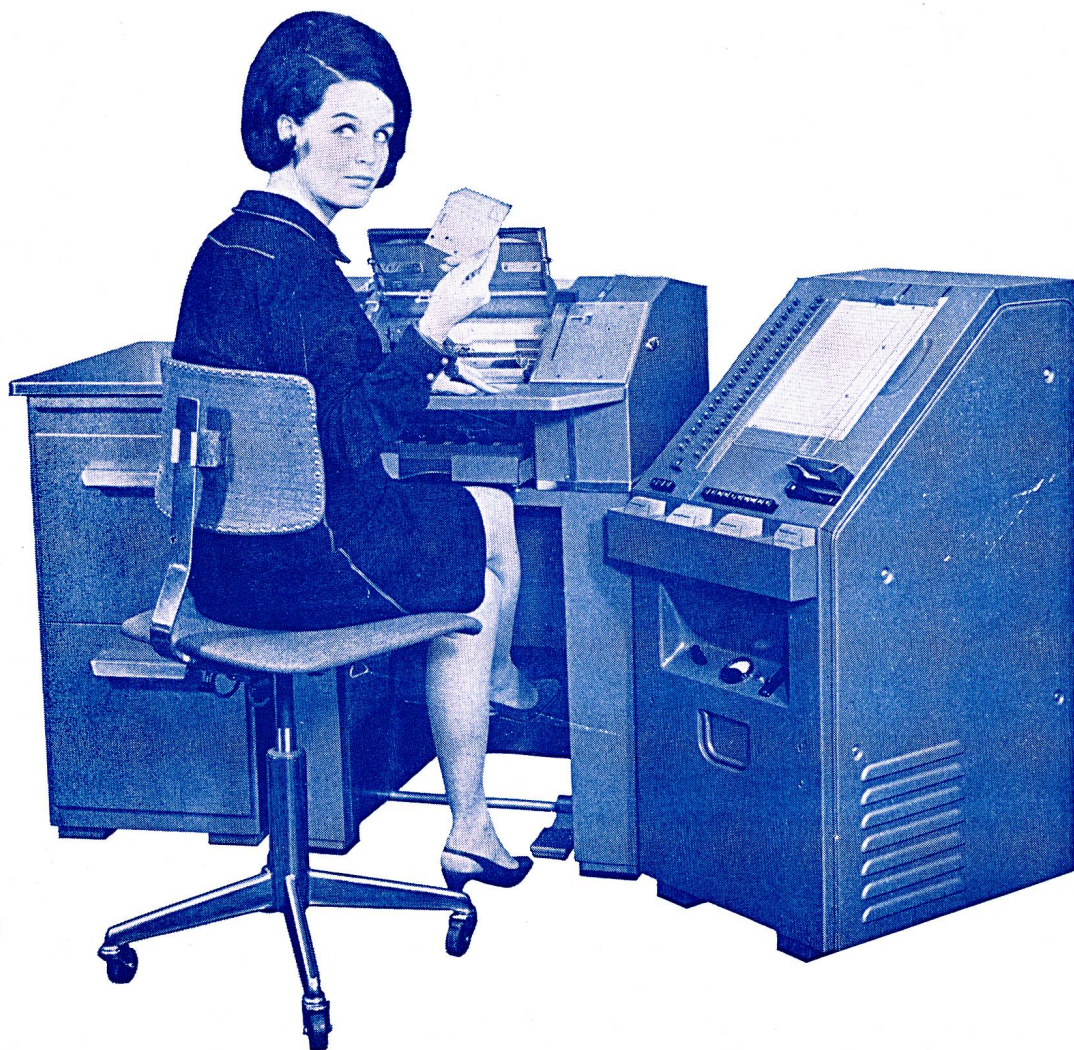
Modell Electronic 20 Modelle für jede Betriebsgrösse und jeden Arbeitsanfall