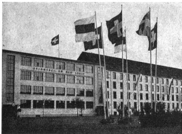
Spinnerei an der Lorze

Anmerkung der Redaktion: Auf der Schweizer Studienreise der Vereinigung Schweizerischer Textiltfachleute, die vom 10. bis 14. Oktober 1966 stattfand, wurden zwölf moderne einheimische Textilbetriebe besichtigt. Um auch einer weiteren Öffentlichkeit einen Einblick in diese fortschrittlichen Firmen zu gewähren, werden in dieser und den folgenden Nummern der «Mitteilungen» alle zwölf Firmen in freier Reihenfolge besprochen. Diese Reportageserie beginnt in der vorliegenden Nummer mit den Berichten über die «Spinnerei an der Lorze», Baar, und die «Feinweberei Elmer AG», Wald.