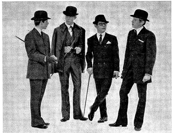
Von links nach rechts:

«Belle époque», Maßmodell, Tagesanzug, einreihig, zweiteilig