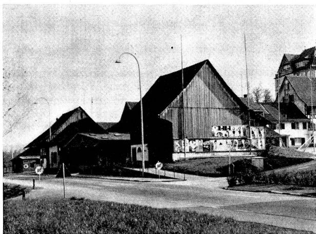
Einst: links aussen das ehemalige Stäubli-Heimwesen, in der Mitte die Scheune des Nachbars Hüni

Der neue Bau gliedert sich in drei Teile: ein prächtiger dreistöckiger Hochbau, den südöstlich anschließenden einstöckigen Shedbau, und einen bergwärts an diesen angegliederten weiteren einstöckigen Bau. Auf dem Rundgang konnte man sich dann von der großzügigen Lösung aller Probleme überzeugen. Im Erdgeschoß des Hochbaues, einer hohen, hellen Halle mit Einfahrt vom Rotweg aus, ist das Magazin für die einzelnen Bestandteile der Schaftmaschinen untergebracht. Der anschließende großräumige Shedbau ist die eigentliche Montagehalle der Schaftmaschinen, wo je drei Arbeiter am laufenden Band eine Arbeitsgruppe bilden und die Maschinen zusammensetzen. Es sind vier solcher Bandstellen vorhanden, von denen die fertigen Maschinen dann auf die Prüfapparate gelangen, wo sie einer gründlichen Leistungs- und Präzisionskontrolle unterzogen werden. Nach dieser Prüfung kommen sie in die anschließende Speditionsabteilung. Im einstöckigen bergseitigen Teil des Neubaus sind alle Zweigbetriebe — ohne die eine Maschinenfabrik heute nicht mehr auskommt — untergebracht. Es seien davon nur ganz kurz die Schreinerei und die Kistenmacherei sowie die Farb-