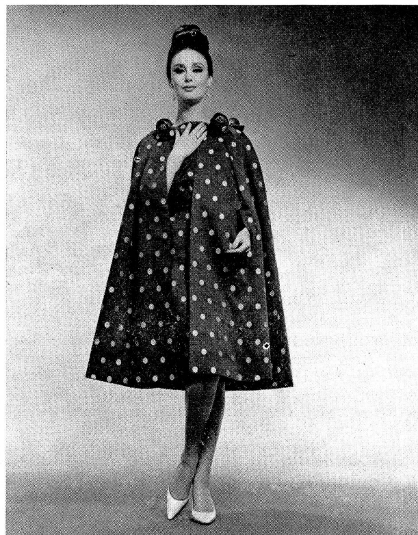
Cocktailkleid mit Cape aus Schweizer Baumwoll-Shantung mit Plumetis-Dessin

mit winzigen Volants, prägt den Typ der neuen Bluse. Die kostbaren Stickereien für den Abend lassen sich von den Bijouterien der Haute Couture, von der Mode der Stufensäume und Fransen inspirieren; «Guipure-Perlen» und «Guipure-Fransen» wirken hier äußerst kunstvoll. Organza-Galons mit Stickerei und auf Tüll gestickte Blüten, in Stufen übereinandergesetzt, sind für sommerliche Cocktailkleider gedacht.