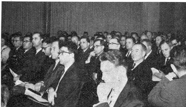
Mit großer Aufmerksamkeit folgen die Tagungsteilnehmer den Ausführungen der Referenten

Beim folgenden Aperitif, der von der VST allen Tagungsteilnehmern offeriert wurde, ergab sich die Gelegenheit eines vielseitigen Gedankenaustausches, welcher von den Besuchern gerne benützt wurde. Freunde und Bekannte wurden begrüßt, nach Lust und Laune diskutiert und so der Uebergang zum gemeinsamen Mittagessen gefunden.