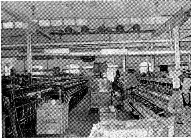
Aerosol-Batterie mit 4 Apparate-Einheiten in einer Spinnerei

Sie verteilen sich rasch und gleichmäßig nach allen Seiten, werden bis zu ihrer vollständigen Verdunstung in der Luft in der Schwebe gehalten und können sich