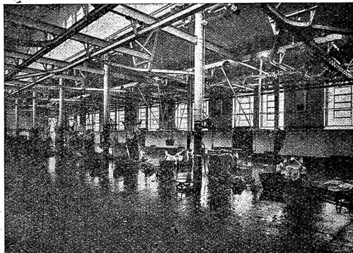
Luftverhältnisse im Raum 8-10 Minuten nach Inbetriebnahme. Trockene Wände, volle Betriebsübersicht.