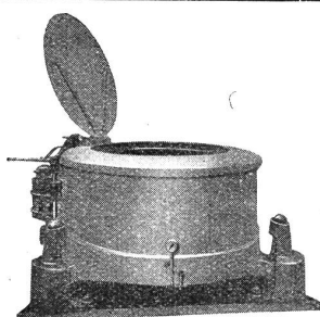
Färberei- und Appreturmaschinen Atelier de Construction L. Crosset S. A. Verviers

Die Inhaberin des Schweiz. Patentes Nr. 128,958 vom 5. September 1927, betr. „Spinnverfahren für die Baumwollspinnerei“ wünscht das Patent zu verkaufen, in Lizenz zu geben oder anderweitige Vereinbarungen für die Fabrikation in der Schweiz einzugehen. — Anfragen befördert H. Kirchhofer , vorm. Bourry-Séquin & Co., Ingenieur- und Patentanwaltsbureau, Löwenstraße 51, Zürich 1. 3777