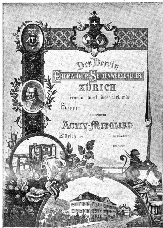
Mitglieder-Urkunde des Vereins ehemaliger Seidenwebschüler Zürich.*