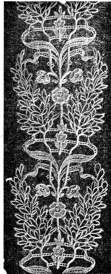
Moderne Spitzenborde, St. Galler Fabrikat

bringt, dürfte die besondere Begünstigung des Damasségeschmacks sein. Es werden in ein- und