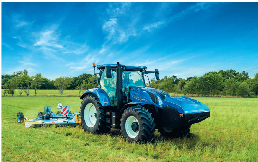
Pour la première fois, la statistique suisse recense l'immatriculation d'un tracteur dont le moteur fonctionne au gaz: un New Holland «T6.180 Methane Power».