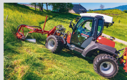
Le modèle Sauerburger «Grip 4-70» poursuit sa progression dans le marché des faucheuses à deux essieux.