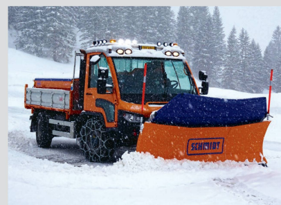
Aebi dope ses ventes dans un marché des transporters en léger recul.