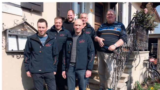
Les membres du comité de la section Jura-Jura bernois présents à l'assemblée générale arborent la nouvelle veste acquise aux couleurs de l'association.