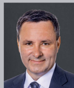
Werner Salzmann Conseiller aux Etats, président Mülchi (BE)