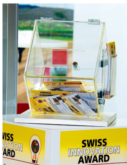
Un objet très recherché sur le stand de l'ASETA: l'urne recueillant les votes pour désigner le «Swiss Innovation Award».

Bächtold a développé la première griffe à fourrage de Suisse capable d'exécuter ses fonctions sans l'aide d'un opérateur. Dès que l'agriculteur a quitté la zone de sécurité et confirmé auprès du centre de commandes la possibilité de débiter le travail, la griffe commence en toute autonomie à saisir le foin et à le transporter jusque dans la cellule de stockage. La préhension des quantités récoltées est faite automatiquement et implémentée dans le processus. Le pilotage définit un déroulement optimisé et le positionnement de la grue. Afin de ne pas effectuer de trajets superflus, le degré de remplissage de la griffe est surveillé et éventuellement complété d'une seconde prise dans la zone de déchargement. ■