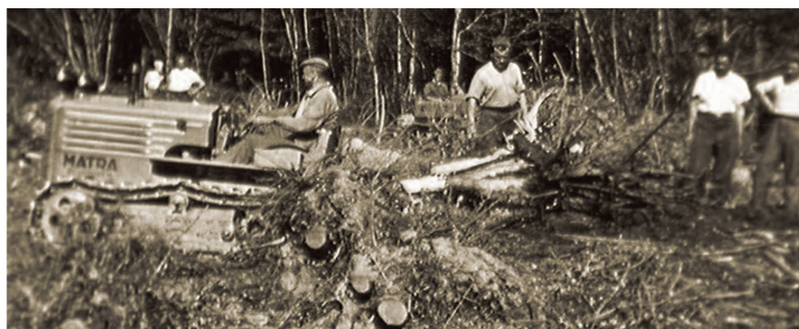
Lavori di bonifica sul Piano di Magadino, nel 1940.

c) La rappresentanza degli interessi dei proprietari delle macchine di fronte al commercio, alle Autorità, alle Società di Assicurazione, ecc.;