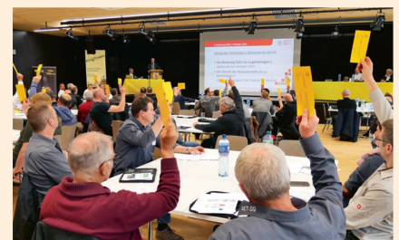
Les délégués ont approuvé toutes les propositions du comité.