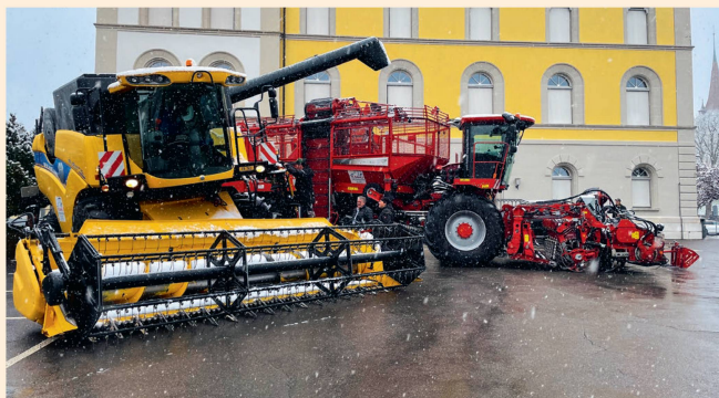
Les délégués ont admiré une moissonneuse New Holland et une récolteuse de betteraves sucrières Holmer exposées en leur honneur.