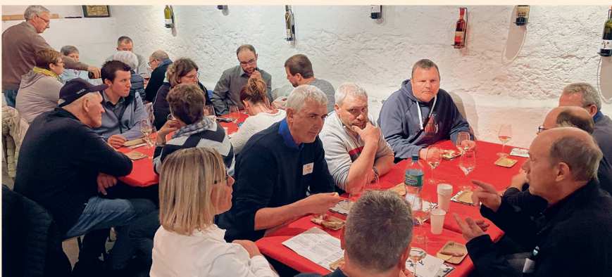
L'excursion s'est terminée par une dégustation de vin dans différentes caves du Vully.