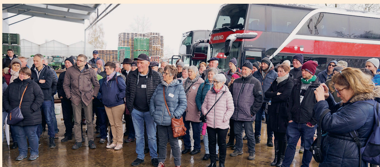
Arrivée à l'exploitation maraîchère Gutknecht, à Essert (FR) – Ried bei Kerzers en allemand.