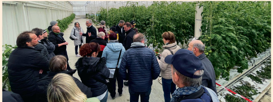
Visite de la serre de tomates: l'exploitation Gutknecht Gemüsebau produit un grand nombre de variétés de tomates et d'autres légumes. Elle les vend aussi dans son magasin de ferme.