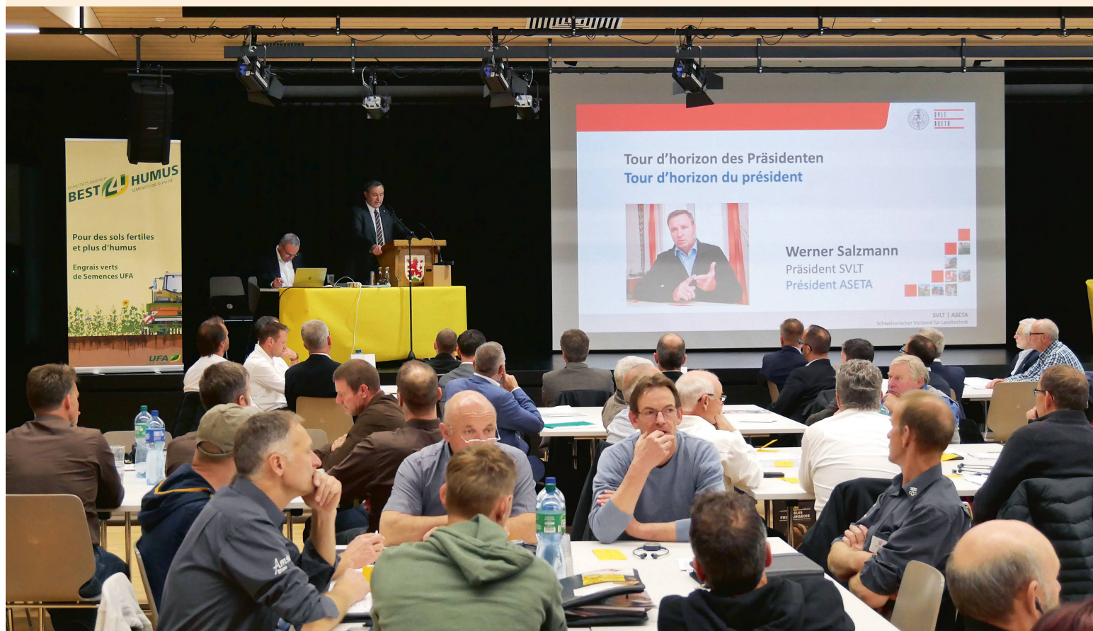
Réunis à Morat (FR), les délégués ont pris connaissance avec satisfaction de la bonne marche des affaires de l'ASETA.