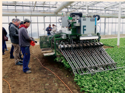
La machine cueille les radis et les bottelle en une seule étape.