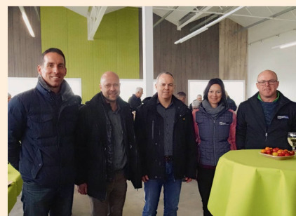
Un apéritif a été servi après la visite des exploitations maraîchères du Seeland.