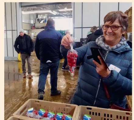
On a pu emporter des radis frais!