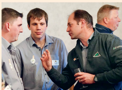
Les délégués schaffhousois sont engagés dans une discussion animée.