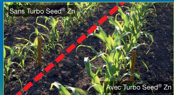
Application lors de l'ensemencement (microgranulateur)