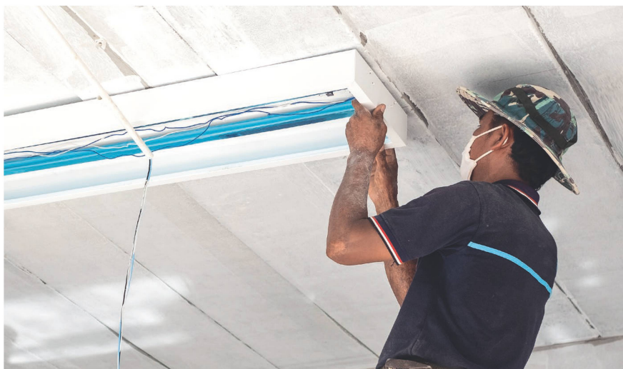
L'utilisation de luminaires «basse consommation» dans les bâtiments de production contribue à limiter la dépense énergétique de la ferme.