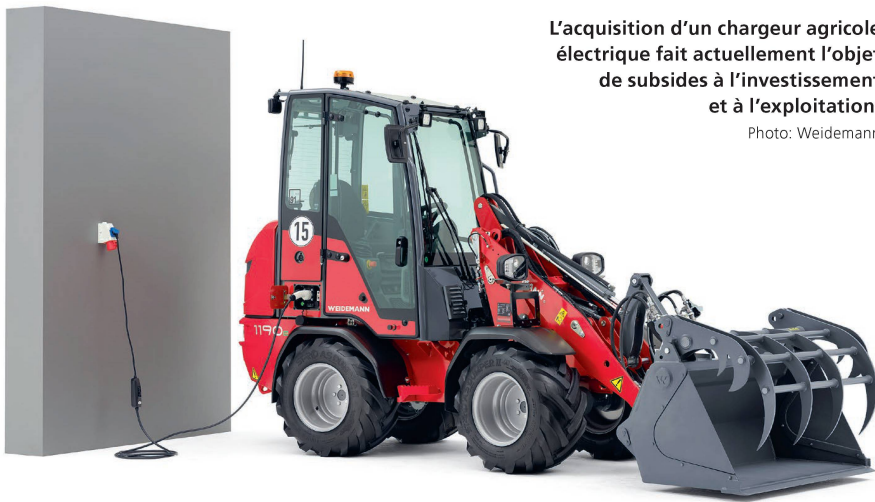
L'acquisition d'un chargeur agricole électrique fait actuellement l'objet de subsides à l'investissement et à l'exploitation.