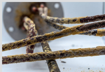
L'accumulation de calcaire (tartre) sur la résistance d'un chauffe-eau électrique dans les zones disposant d'une eau à dureté élevée diminue ses performances.