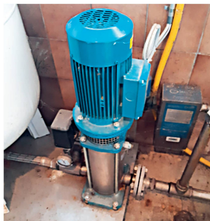
Les viticulteurs assurant leur propre vinification peuvent remplacer certains équipements par du matériel plus efficient.