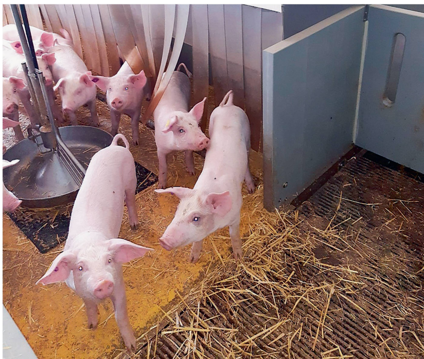
En mise bas et post-sevrage, le programme Prokilowatt de l'OFEN soutient la conversion des caisses à porcelets à chauffage électrique en systèmes économes en énergie.

Infos sur www.agrocleantech.ch sous l'onglet «Agriculteurs».