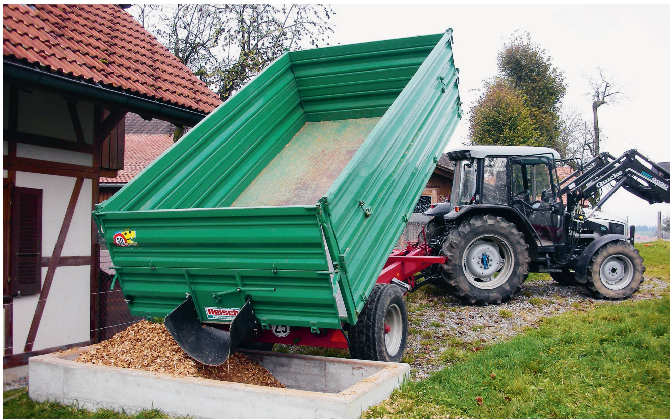
L'ordonnance sur les améliorations structurelles prévoit des aides à fonds perdus pour les installations qui servent majoritairement à l'autoapprovisionnement de la production agricole.