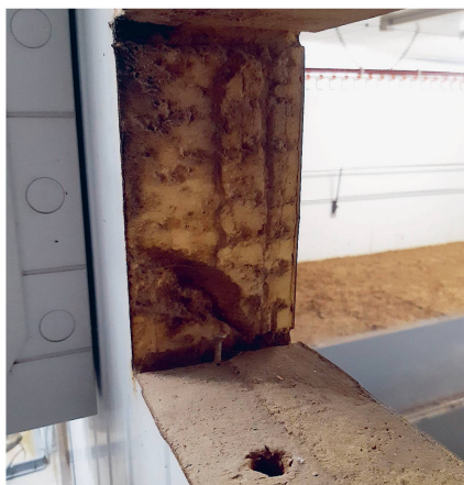
Une isolation performante réduit sensiblement les pertes en chaleur des bâtiments porcins et avicoles.

Dans le cadre de la loi sur le CO 2 , les importateurs de carburants fossiles ont