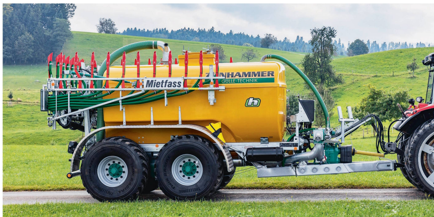
Les citernes à lisier de Hadorn peuvent aussi être louées sur FarmX.

nautés. En collaboration avec des hautes écoles et des organisations agricoles existantes, nous voulons montrer encore plus clairement que les échanges entre exploitations permettent de réduire les coûts pour chaque agriculteur. Le seul moyen d'abaisser significativement les coûts des machines par exploitation est d'augmenter leur taux d'utilisation. FarmX serait heureuse de contribuer à atteindre cet objectif.