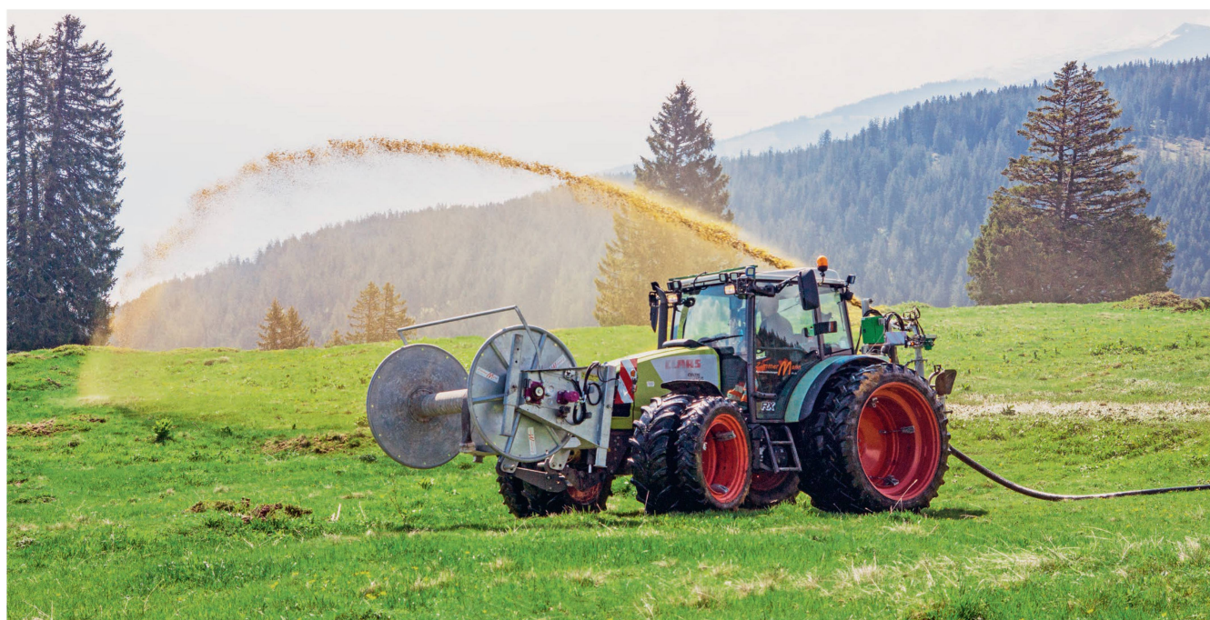
En montagne et en terrains accidentés, la maison recourt à des méthodes d'épandage aux tuyaux.

«Aujourd'hui, nous nous déplaçons avec notre matériel dans un triangle entre Bad Ragaz au sud, Rugell en Principauté du Liechtenstein au nord et jusqu'à Mollis à l'ouest, dans le canton de Glaris. Complètement idéal de l'installation d'épandage aux tuyaux, le semi-remorque nous sert à transporter le lisier dans toute la Suisse orientale, voire dans l'ensemble du pays. Nous sommes aussi présents avec des prestations plus classiques, comme la préparation du sol et la récolte de fourrages, mais ce n'est pas prioritaire pour nous. Nous possédons en outre une faucheuse combinée, et sommes équipés pour faner et andainer. Pour la récolte de fourrage, nous mettons à disposition une autochargeuse. Nous proposons aussi un service de labour à la charrue et de préparation du terrain pour les semis à la herse à