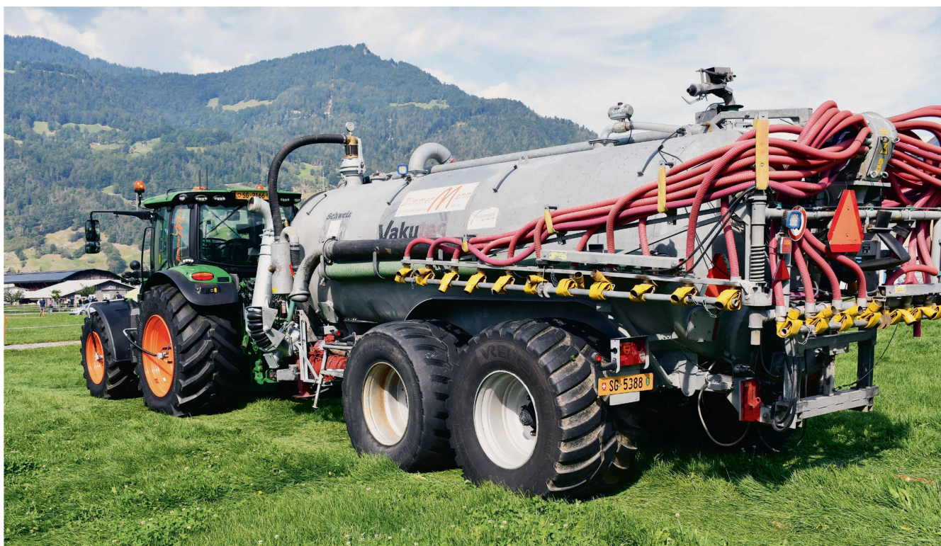
Le parc de machines est notamment constitué de citernes et de rampes à pendillard.

L'inscription en lettres orange sur le tracteur à sellette n'est pas l'unique signe distinctif de l'entreprise: elle a aussi pris la liberté de peindre en orange toutes les jantes de John Deere!