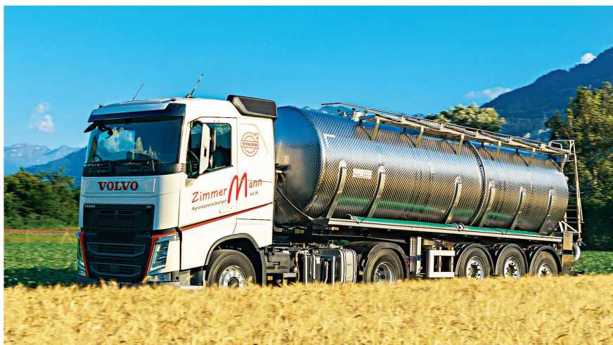
Le camion pour les transports de la ferme aux champs, c'est efficace et rapide!