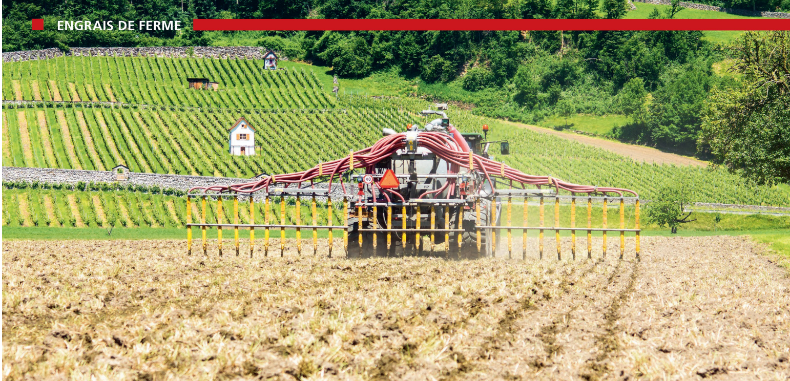
Chez le prestataire de services agricoles ZimmermannMels, en pays de Sargans, le pendillard est un outil essentiel.