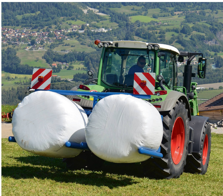
Ce qui est permis dans les champs ne l'est pas sur la voie publique. Une fourche à balles rondes ne dispose d'aucune surface de charge et ne peut en conséquence pas transporter de marchandises sur la route. Le service des automobiles cantonal accorde une autorisation pour le faire à titre exceptionnel.