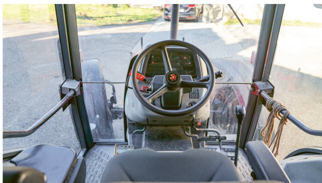
La cabine intégralement vitrée offre une vue panoramique.