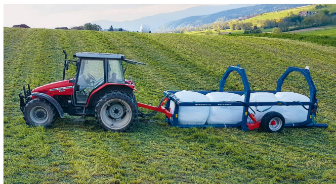
Le tracteur attelé à une ramasseuse de balles rondes.