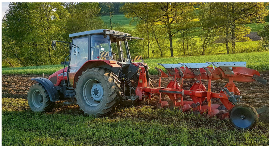
Ce MF est aussi à l'aise pour des travaux plus pénibles.