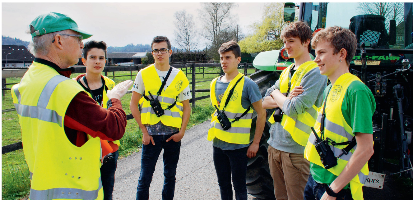
Cette année, l'offre de cours pour jeunes conductrices et conducteurs de tracteur est à nouveau bien fournie.