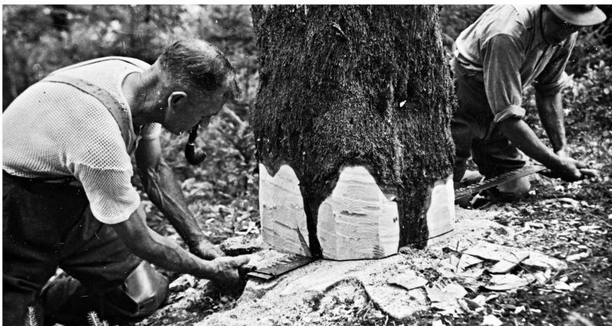
En visualisant cette photo de 1933, on constate que le travail en forêt s'est profondément modifié avec les avancées de la mécanisation.

La forêt occupe le tiers du territoire suisse, soit 1,32 millions d'hectares ou 1600 mètres carrés par habitant. Elle se compose de 497 millions d'arbres vivants et de 60 millions d'arbres morts, d'un âge moyen de cent ans. Bon nombre d'entre eux étaient encore des arbrisseaux au moment de la fondation de ForêtSuisse en 1921. Forte de 600 exploitations et 900 entreprises, la filière forêt-bois génère 100 000 emplois. En outre, des milliers de particuliers, parmi lesquels beaucoup d'agriculteurs, exploitent leur bois