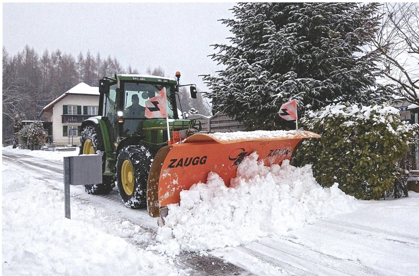
Les tarifs des services hivernaux de cette année s'avèrent, en comparaison de l'année passée, stables ou en léger recul.

Pour de nombreuses exploitations agricoles petites et moyennes, l'usage du tracteur en dehors des activités agricoles est une possibilité intéressante d'accroître l'utilisation et donc la rentabilité. Le déneigement pour les communes ou pour les privés (routes privées ou grands parkings) en est un exemple répandu. Les tracteurs agricoles munis de plaques d'immatriculation vertes sur la voie publique nécessitent pour cela une autorisa-