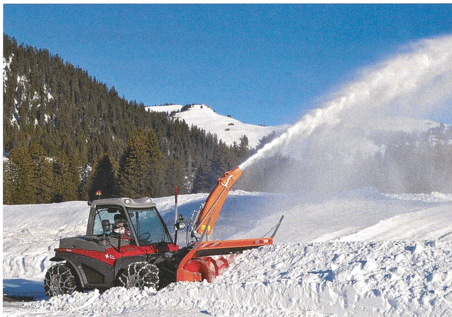
Le tarif «Fraise à neige» pour les véhicules de 56 à 109 ch a baissé de 2,38 francs par heure.

Dans la pratique, les coûts effectifs s'éloignent le plus souvent des valeurs moyennes publiées. C'est pourquoi le programme de calcul «TractoScope» a été lui aussi actualisé. Le fichier Excel correspondant peut être téléchargé gratuitement sur le site internet www.maschinenkosten.ch . Les situations individuelles peuvent ainsi être prises en considération précisément. Le calcul des coûts est ainsi ajusté correctement aux valeurs de situations spécifiques connues. Diverses variantes peuvent également être calculées. Les coûts élevés de réparations et d'entretien liés au déneigement doivent être ajustés manuellement. Les résultats calculés peuvent également être utilisés comme base utile de négociation.