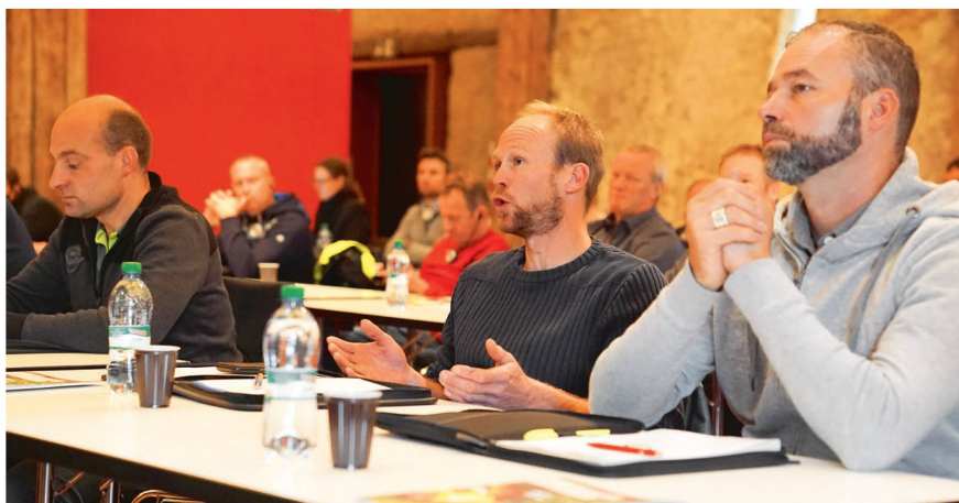
Des discussions animées ont eu lieu lors de la conférence des cadres.