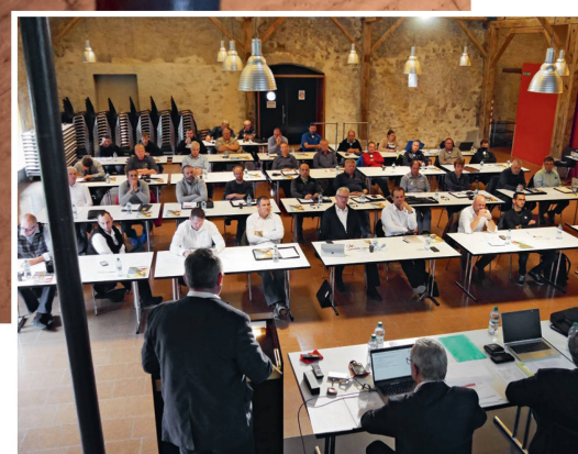
La conférence des cadres 2021 s'est tenue dans l'ancien pressoir de Villigen (AG).