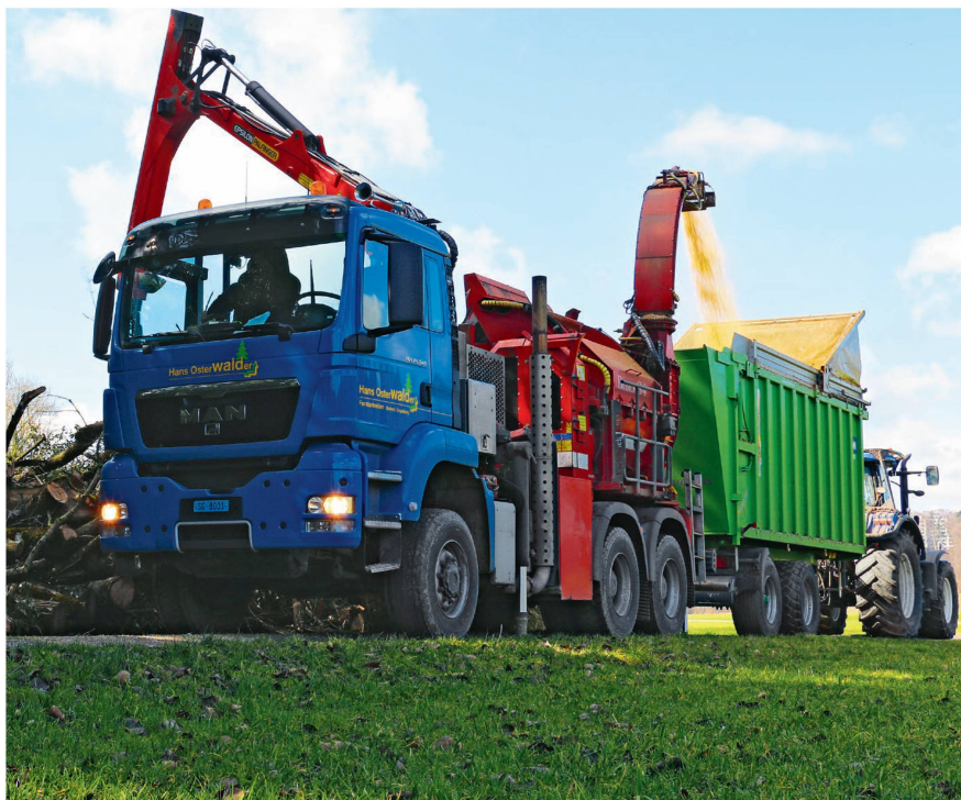
Les plaquettes provenant de rémanents de coupe comportent une forte proportion de feuilles, d'aiguilles et d'écorces. Leur teneur en azote sera d'autant plus élevée.

Le bon fonctionnement des chauffages automatiques au bois à faibles émissions est largement tributaire de l'approvisionnement en plaquettes de bois de qualité. Par plaquettes de qualité on entend des plaquettes ne contenant qu'une faible quantité de feuilles, d'aiguilles et d'écorces. La meilleure déchiqueteuse ou le meilleur broyeur ne pourrait produire des plaquettes d'une qualité supérieure à celle du matériau de départ. Il n'y a aucun doute possible: c'est bien le matériau de départ qui détermine la qualité. ■