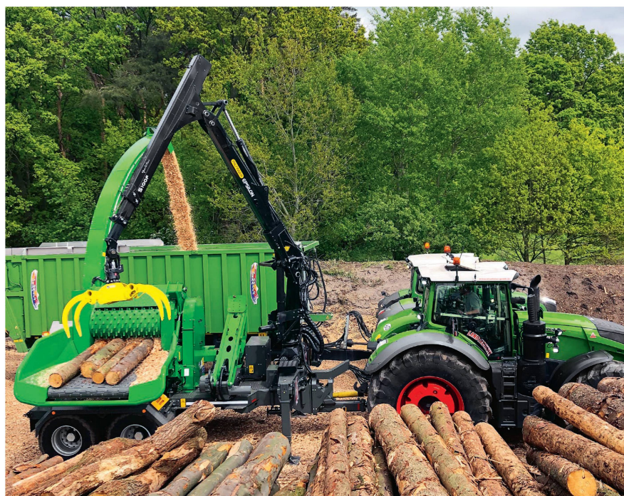
À partir de grumes, la déchiqueteuse produit des plaquettes dépourvues de fraction fine.

Le séchage permet de réduire le taux d'humidité des plaquettes et d'augmenter leur pouvoir calorifique. On distingue les séchages «naturel» et «technique». Le séchage par convection naturelle fait appel aux sources d'énergie du soleil, du vent ou de l'échauffement spontané des plaquettes. Le principe est simple: l'air contenu dans la pile de plaquettes se réchauffe, s'élève et évacue ainsi leur humidité. La dépression qui en résulte provoque une arrivée d'air frais extérieur par le bas. Les plaquettes séchent ainsi en quelques mois. Le stockage en plein air est particulièrement adapté aux plaquettes grossières. Normalement, l'eau de pluie ne pénètre pas le bois de plus d'un demi-mètre. Avec une teneur en eau de plus de 30%, une perte considérable de substance dans la biomasse sèche se produit lors du séchage naturel. En cas de précipitations régulières entraînant la formation d'une couche extérieure humide, une infection fongique est susceptible de se produire