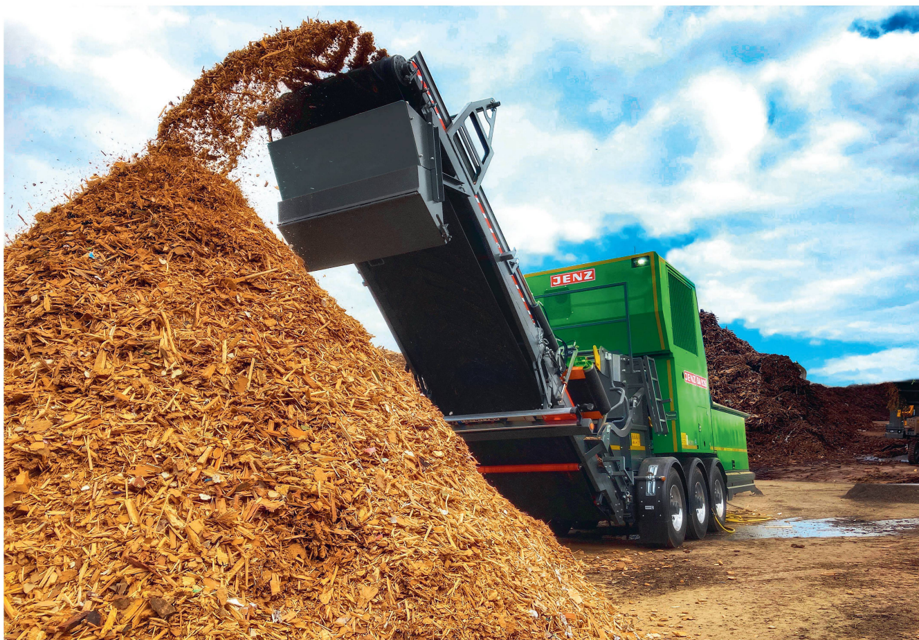
Les broyeur produisent des plaquettes de bois irrégulières, fibreuses et brisées.