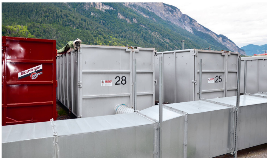
Le principe du conteneur de séchage réside dans le fait que le matériau à traiter est traversé par de l'air chaud remontant par le bas.

surtout au sommet du tas, aggravant les pertes de substance. Il est donc recommandé de recouvrir les plaquettes en plein air d'un matériau non-tissé perméable à la vapeur.