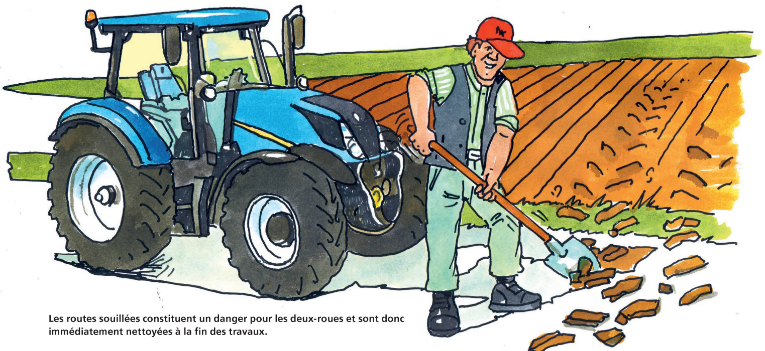
Les routes souillées constituent un danger pour les deux-roues et sont donc immédiatement nettoyées à la fin des travaux.

Les illustrations sont mises gratuitement et sous différents formats à disposition des médias mais aussi d'autres organisations et de particuliers. Cette campagne se poursuivra dans une phase ultérieure avec d'autres actions telles que la diffusion de messages et de courtes vidéos sur les réseaux sociaux.