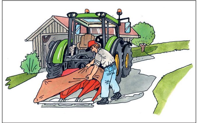
Les pointes, les arêtes tranchantes et autres parties dangereuses des machines sont enlevées, recouvertes ou au moins marquées.