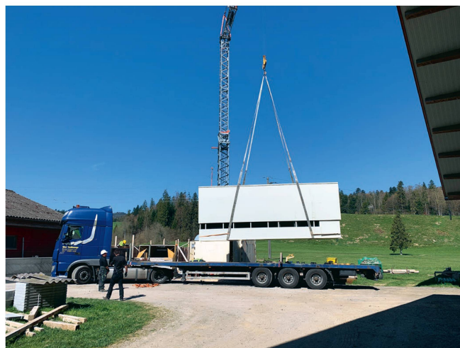
Un laveur d'air biologique est amené par la société Jenni à son emplacement définitif dans un conteneur préfabriqué.