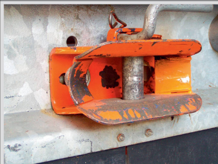
De nombreuses bouches d'attelage ne sont pas adaptées pour tracter une seconde remorque.