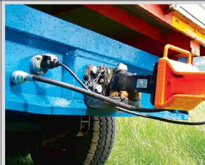
L'attelage à boule K80 présente également des avantages en tant qu'attelage à l'arrière des remorques.