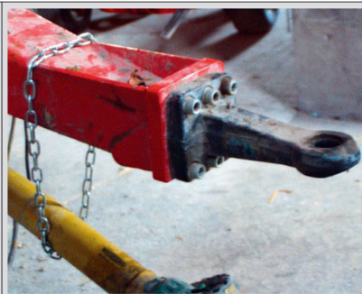
L'anneau du timon sur la remorque est souvent utilisé et présente un jeu inadmissible.