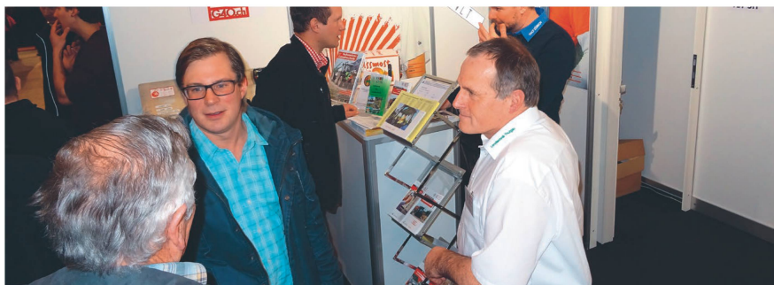
L'ASETA tient un stand au salon Tier & Technik, à Saint-Gall (halle 1.1, stand 1.1.04). Des experts y répondent aux questions liées à la circulation routière.

Pour cette édition anniversaire, le salon Tier & Technik accueille plus de 500 exposants, dont l'ASETA, de nouveau sur place avec un stand.