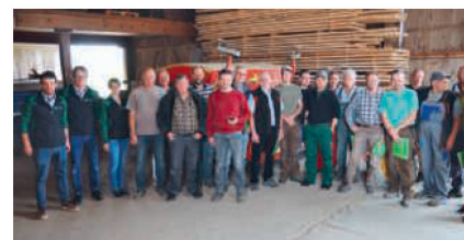
Les 30 agriculteurs de la CUMA de Rheinklingen possèdent ensemble 45 machines gérées via « FarmX ».

« FarmX » est une plate-forme suisse d'échanges de machines agricoles. Sa création est le fruit d'une collaboration entre des agriculteurs et diverses communautés de machines; elle a ensuite été testée en grandeur réelle. Depuis mi-février, cet outil fonctionne soit sous forme d'application pour smartphone ou en ligne sur internet. Lancée à l'origine par la Chambre jurassienne d'agriculture et des organisations partenaires avec le soutien de l'Office fédéral de l'agriculture, « FarmX » bénéficie aujourd'hui de nombreux soutiens parmi lesquels figurent l'Association suisse pour l'équipement technique de l'agriculture (ASETA) et Maschinenring Schweiz. ■