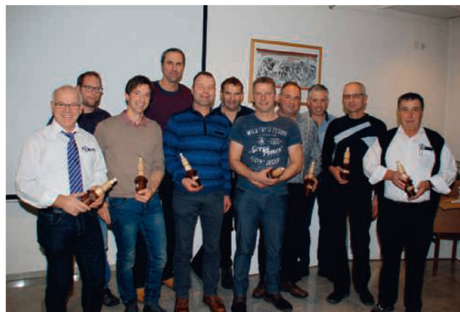
À l'AG de la section lucernoise, les anciens membres des comités des cercles de machines lucernois dissous ont été honorés pour leur travail.

La LVLT a désormais 1700 membres (contre 1400 auparavant). Les modifications de l'OETV concernant les systèmes de freinage et le porte-à-faux avant ont également été évoquées à l'AG. Anton Moser a encore invité les membres à penser au nettoyage intérieur continu des pulvérisateurs. Josef Erni a présenté les comptes et le budget, tous deux positifs. La cotisation reste la même. La LVLT a testé l'an dernier 101 pulvérisateurs de grandes cultures et 25 pulvérisateurs avec souffleuse. Les prochains contrôles sont prévus pour le mois de mars (voir page 59). Les inscriptions peuvent être adressées à la gérance. Josef Erni a signalé que le nombre de participants aux cours de conduite (en particulier ceux préparant à l'examen de scooter) était en recul. Sepp Iten a démissionné du comité dans lequel il a siégé pendant 11 années pour des raisons de santé. Lui succède Sepp Felder, de Rechtswil, actif auparavant dans les cercles de machines. Les anciens membres des comités des cercles de machines lucernois dissous ont été félicités de leur engagement au service de l'agriculture.