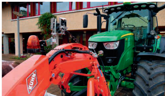
Le porte-à-faux avant peut atteindre 5 m si le véhicule est doté d'un système de caméra combiné à un feu de danger.