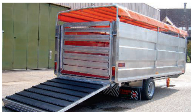
Une grille de fermeture arrière se justifie dans ce cas, mais pas sur les bétailières dont la surface de chargement s'abaisse.

Le comité de l'ASETA ainsi que de nombreux éleveurs attendent avec impatience la réponse qui devrait être donnée lors de la session de printemps 2019. ■