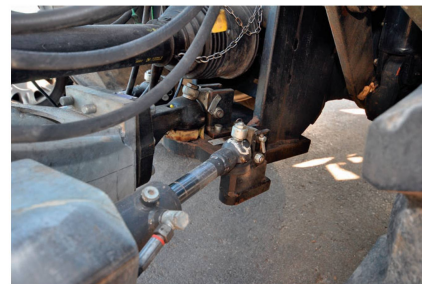
Les restrictions concernant la charge d'appui au timon appliquée aux tracteurs industriels doivent être supprimées.

Conformément à la législation européenne, la charge d'appui des remorques agricoles équipées d'attelage à boule ne doit pas dépasser 4 t au timon sur le véhi-