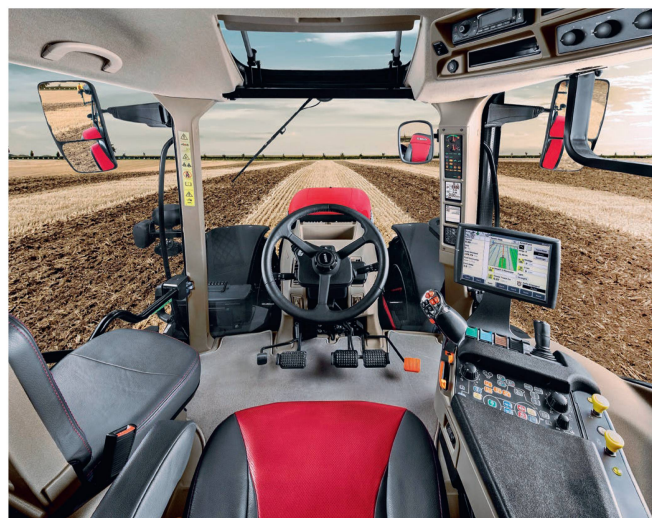
Système de guidage vu depuis le poste du conducteur.

Présentation et démonstration des systèmes de guidage GPS les plus modernes adaptables aux véhicules et tracteurs de toutes marques. La manifestation a lieu par tous les temps et est ouverte à toutes les personnes intéressées.