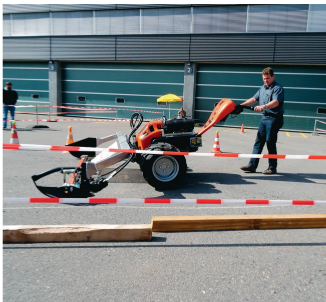
101 concurrents exactement ont pris le départ du Championnat de conduite de tracteur de la section saint-galloise.

les tracteurs à gazon. Les sponsors ont permis de mettre sur pied une belle compétition avec des prix motivants.