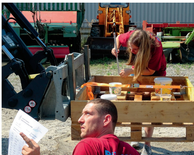
Le nombre exact de points obtenus à un poste s'est souvent décidé au millimètre près.

Le Championnat de conduite de tracteurs zurichois a réuni cette année une centaine de participants (72 Messieurs, 16 Juniors et 7 Dames) sur le terrain de la société HM-Maschinen, à Marthalen. La jeunesse rurale « Ryfall » et la section zurichoise de l'ASETA l'ont organisé conjointement et concocté un parcours où les concurrents pouvaient déployer toute leur habileté. Outre la partie théorique obligatoire ainsi que les épreuves coutumières, entre autres la bascule et le « fil chaud », le thème « numérisation » a fait pour la première fois l'objet d'un poste : un pousse-fourrage de Tpy « Juno » de Lely devait être piloté dans un circuit constitué de balles de paille.