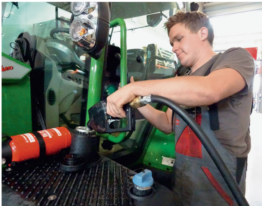
L'ASETA va s'engager avec force pour que le remboursement de l'impôt sur les huiles minérales soit maintenu.

Ce remboursement garde encore tout son sens, parce que les exploitants agricoles et forestiers profitent à peine des infrastructures routières avec leurs vé-