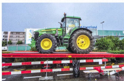
Frisson garanti sur la bascule lors du 18 e Championnat de conduite de tracteur zougnoise.

Autres attractions: parcours enfants, place de sable, buvette avec barbecue ouverte toute la journée et cadeau souvenir. Armin Rebsamen, président du CO, se tient volontiers à disposition pour répondre à toute question (armin.rebsamen@bluewin.ch, 076 480 21 56).