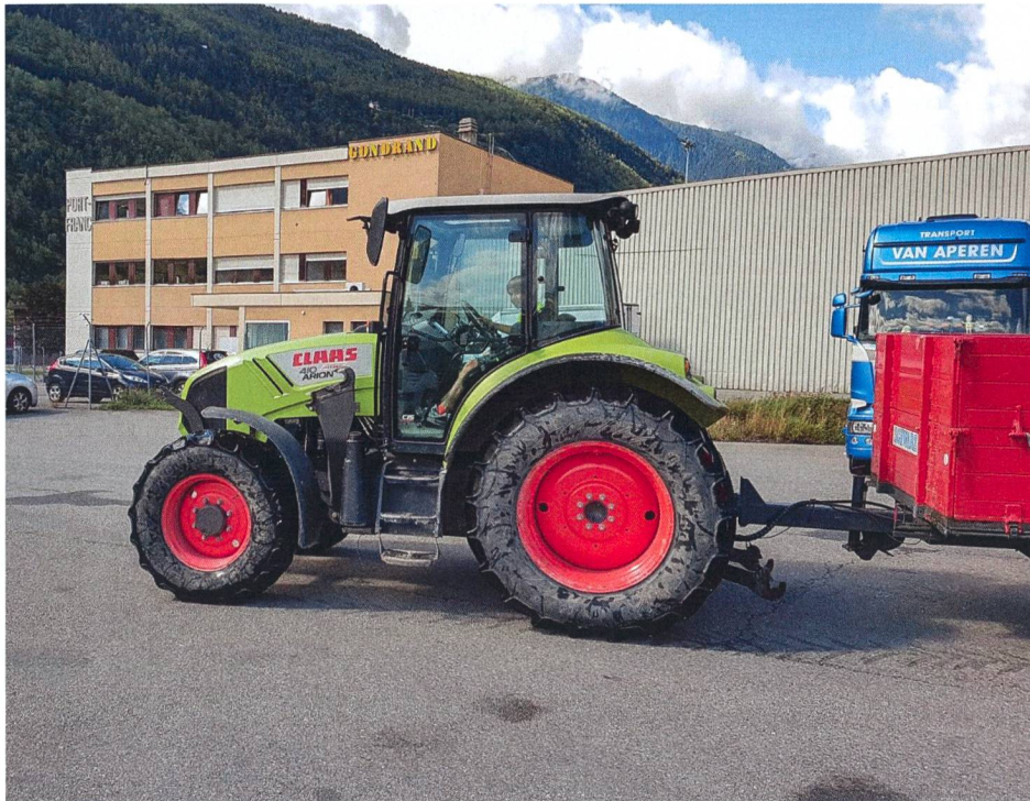
Le cours G40 de l'ASETA dispose maintenant d'un nouveau site, le Port Franc de Martigny.