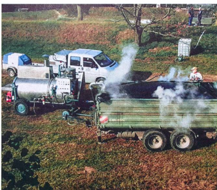
Remorque avec dispositif de stérilisation : la stérilisation sur remorque peut se faire directement sur place. Une remorque de l'exploitation est équipée.

**** Les données concernant la consommation de fuel proviennent des fabricants.