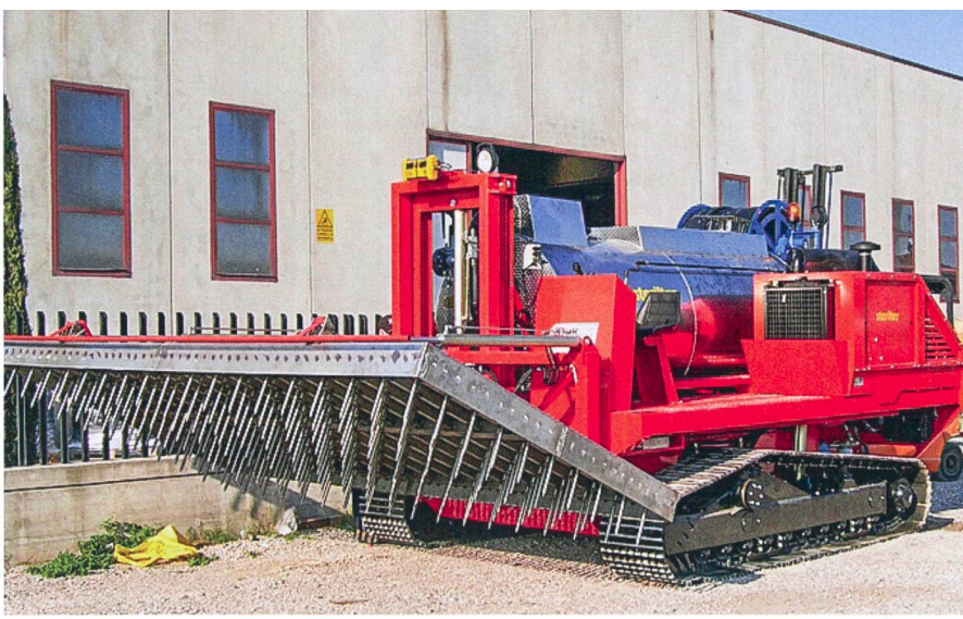
Traitement par injection de vapeur : la vapeur pénètre dans le sol à une température de 80 à 90°C par le biais de cylindres injecteurs.