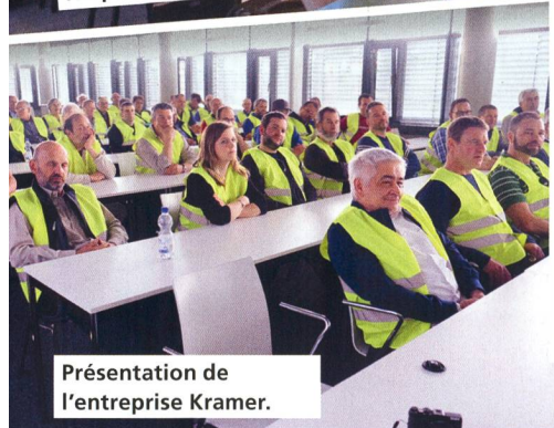
Présentation de l'entreprise Kramer.