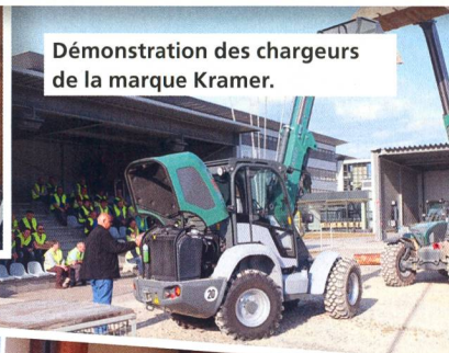
Démonstration des chargeurs de la marque Kramer.