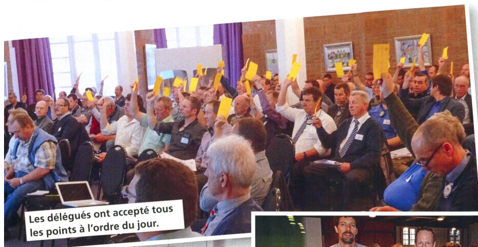
Les délégués ont accepté tous les points à l'ordre du jour.