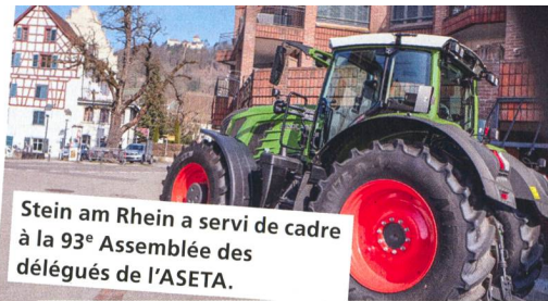
Stein am Rhein a servi de cadre à la 93 e Assemblée des délégués de l'ASETA.