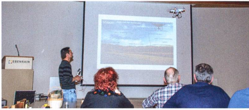
L'utilisation des drones dans l'agriculture a suscité l'intérêt des membres de la section bâloise de l'ASETA.