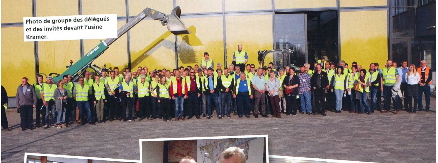
Photo de groupe des délégués et des invités devant l'usine Kramer.