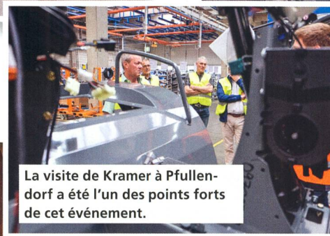
La visite de Kramer à Pfullendorf a été l'un des points forts de cet événement.