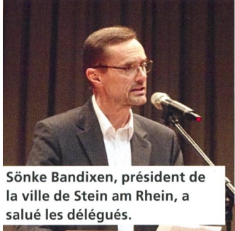
Sönke Bandixen, président de la ville de Stein am Rhein, a salué les délégués.