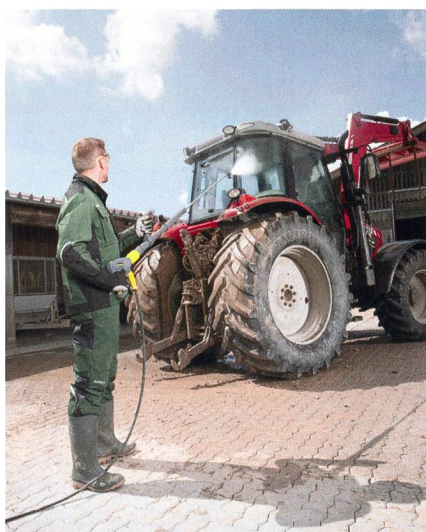
Kärcher, halle 3.1, stand 3.1.17

Kärcher se présente à « Tier&Technik » avec deux produits phares : le « iSolar » et l'« EasyForce ». Le « iSolar » consiste en un accessoire pour les nettoyeurs à haute pression testé et certifié pour le nettoyage basique des modules solaires. Le mécanisme d'ouverture du jet du nouveau pistolet « EasyForce » se situe à l'arrière de la poignée. Une fois enclenché, le recul provoqué par le jet dans la main suffit à le maintenir ouvert. Une fois actionné, il n'y a plus qu'à orienter le jet dans la bonne direction.