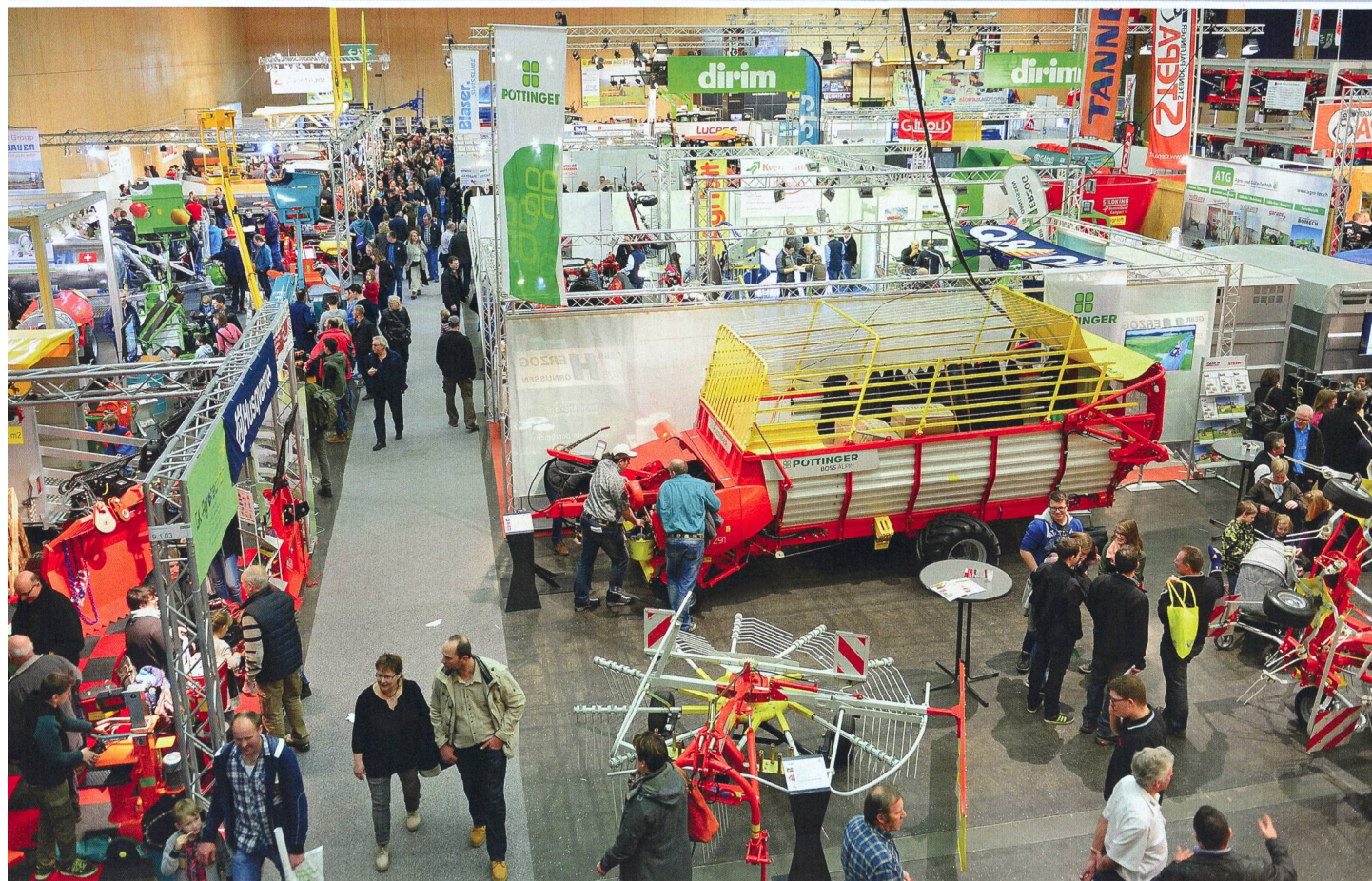
L'exposition «Tier & Technik» occupe une place fixe dans le calendrier des salons agricoles.