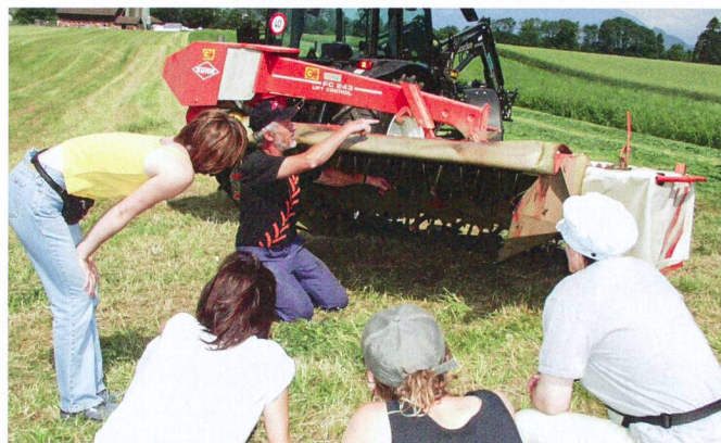
Se familiariser avec la technique et les manœuvres avec tracteurs.