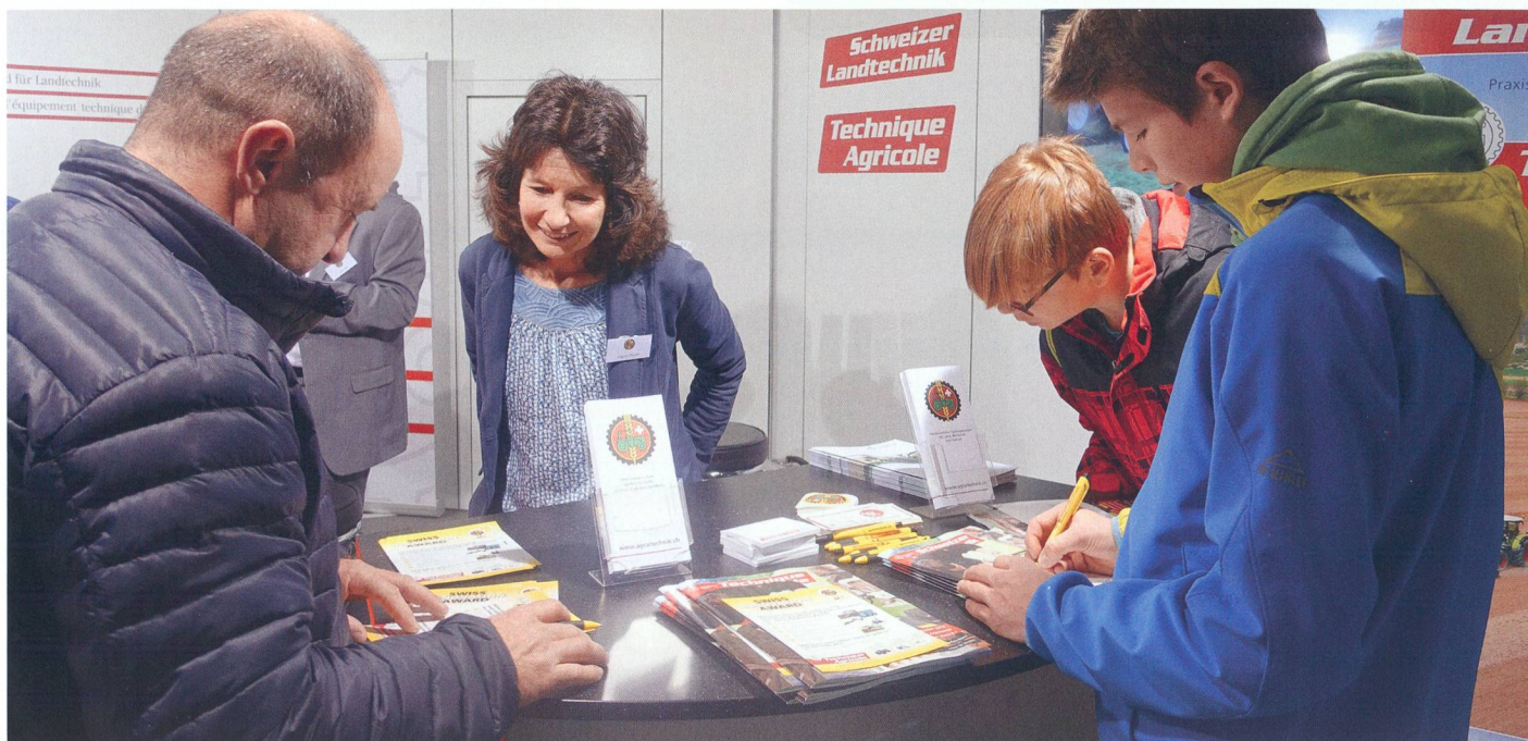
Grande affluence au stand de l'ASETA: le concours «Swiss Innovation Award» a suscité un vif intérêt.