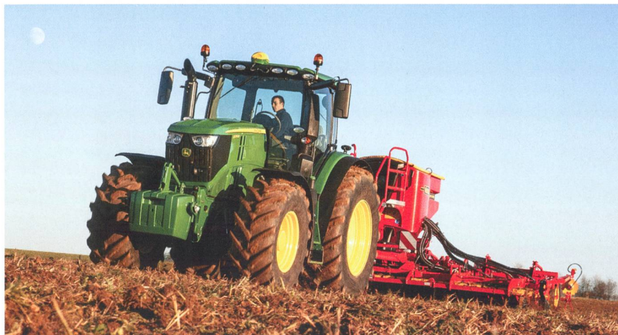
Avec les nouveaux «6230R» et «6250R», John Deere complète la série avec deux modèles affichant un bon rapport poids/puissance.

Avec les deux nouveaux modèles «6230R» et «6250R» dans la classe des 6 cylindres, John Deere étend la gamme «6R» vers le haut. Ces modèles créent un chevauchement voulu avec la série «7R». Les «Mannheimois» sont toutefois plus légers afin de répondre à une demande des clients. Ces nouveaux modèles ont été développés en collaboration avec des agro-entrepreneurs européens. A leur présentation, ces tracteurs livrables à la mi-2017 ont été décrits comme «légers, forts et intelligents».