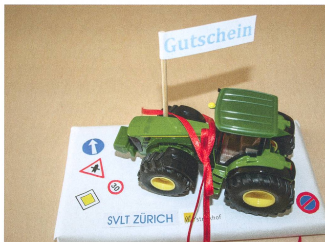
Le cadeau idéal pour votre filleul.

Commande du bon avec modèle réduit de tracteur (échelle 1:50): Stephan Berger, 058 105 99 52 ou stephan.berger@strickhof.ch