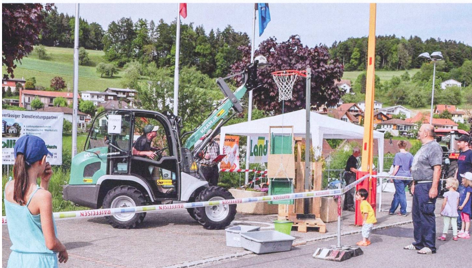
Championnat de conduite de tracteur à Walde (AG): un conducteur – un chargeur – une balle – un panier.

Les participants aux Championnats de conduite de tracteur doivent répondre à des exigences élevées. En plus de conduire avec habileté des véhicules et engins supplémentaires, ils doivent avoir des connaissances techniques dans les domaines des moteurs, des tracteurs, des travaux de maintenance, ainsi que du trafic routier. Sur la base d'épreuves testant ces capacités, ceux qui se classent dans les premiers rangs sont surtout des conducteurs expérimentés possédant un solide savoir-faire.