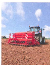
Haute performance et précision des semoirs grâce à des systèmes d'ensemencement sophistiqués.

56 Comptes rendus des sections TI, JU/BE JU, BL/BS, SZ/UR 58 Les Thurgoviens misent sur des transports sûrs 59 60 essieux sur le banc d'essai 60 Sections 62 Portrait du président de la section argovienne 63 Cours et Impressum