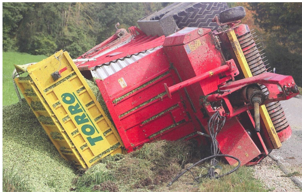
Cette photo provenant d'Allemagne ne se rapporte pas à l'accident précité, mais montre bien les forces destructives libérées par le simple basculement d'une remorque chargée.