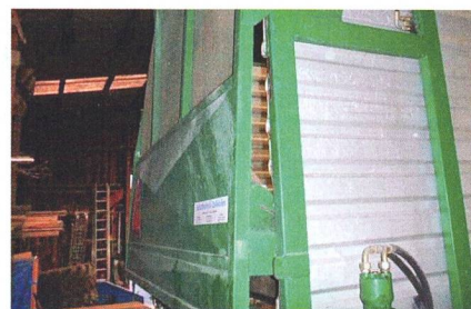
Le hayon ne se referme plus.