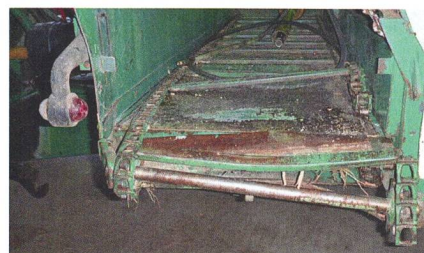
La partie frontale du rail de guidage avec entraînement par chaînes pour le déplacement latéral est déformée.